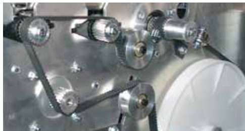
Messungen an verschiedenen Trumlängen möglich

Das Messgerät wird mit 2 handelsüblichen Batterien vom Typ Micro (AAA - Zellen) ausgeliefert und ist daher ohne festen Stromanschluss (Verkabelung) portabel an jedem Messort einzusetzen. Bei Ersatz der Batterien sollte auf entsprechende Qualität geachtet werden, um eine längere Arbeitszeit zu gewährleisten.