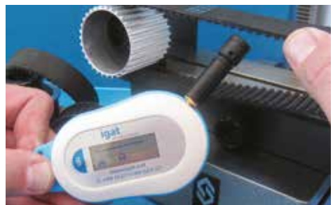
Einfache Bedienung mit einer Hand möglich

Ist die gemessene Frequenz kleiner als der errechnete Wert, muss der Riemen nachgespannt werden. Ist der gemessene Wert größer, muss der Riemen gelockert werden.